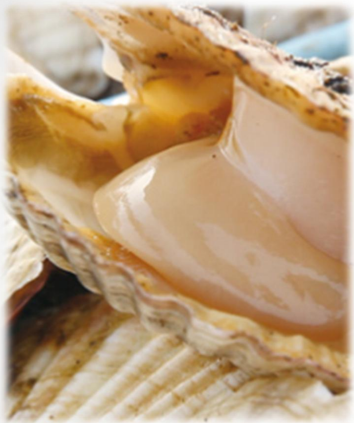
別海町観光協会公式ホームページ