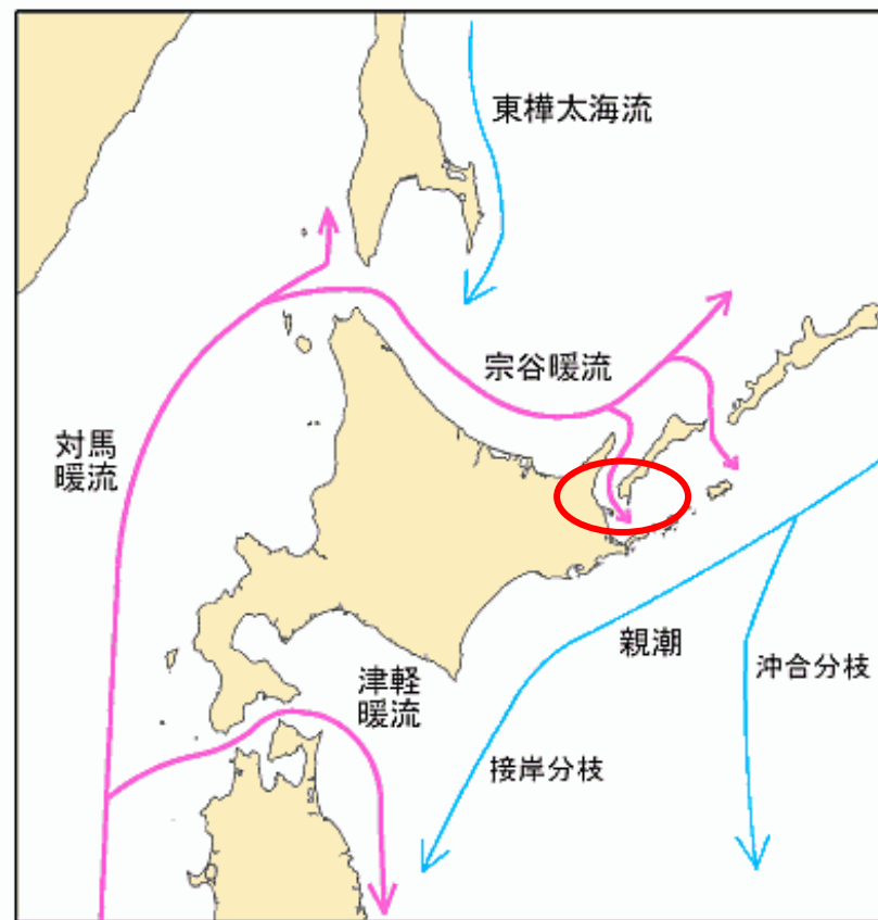
海上保安庁ホームページ 第一管区海上保安本部海洋情報部